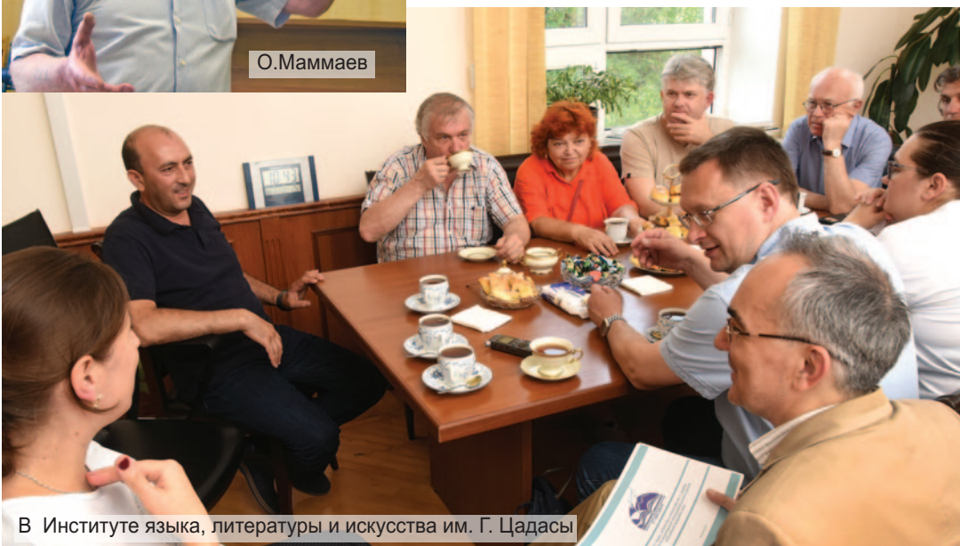
В Институте языка, литературы и искусства им. Г. Цадасы