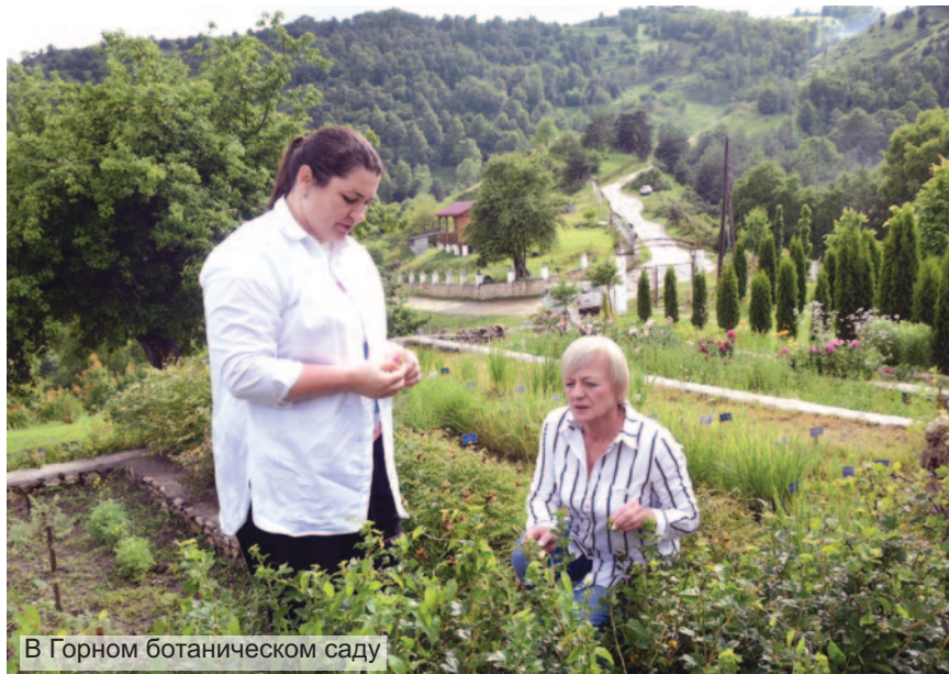
В Горном ботаническом саду