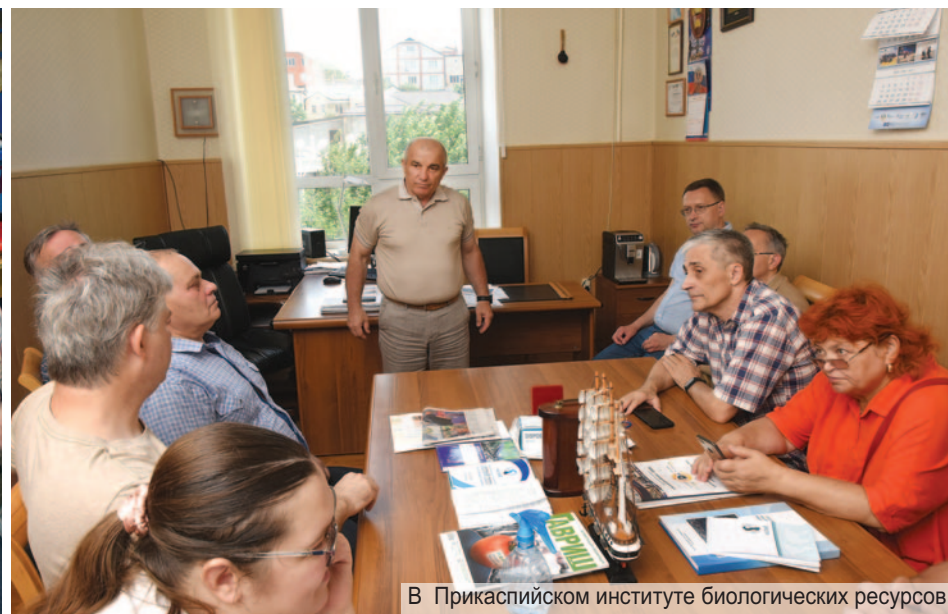
В Прикаспийском институте биологических ресурсов