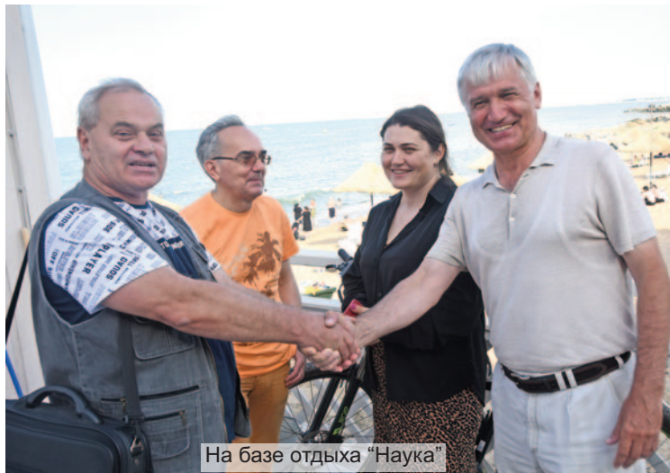
На базе отдыха "Наука"